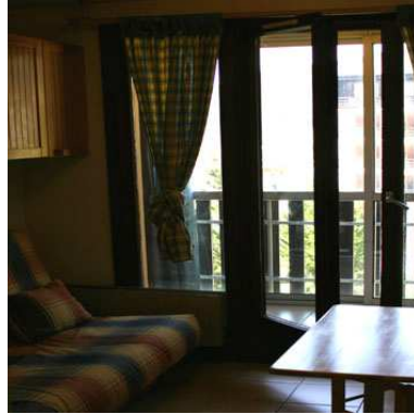
Salle à manger / salon