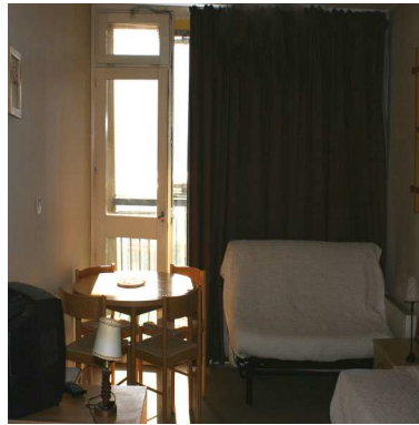
Salle à manger / salon