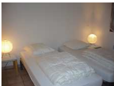
Chambre n° 1